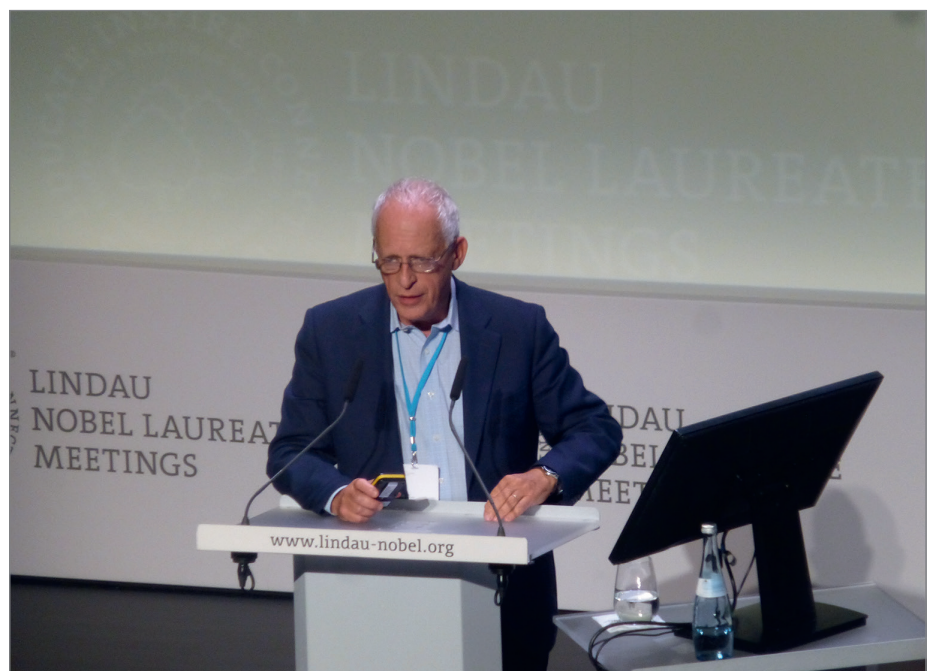
Am Podium standen die Wirtschaftsnobelpreisträger, hier Prof. Dr. Oliver Hart.

Die Treffen der Nobelpreisträger in Lindau haben bereits Tradition. So fand das jährliche Treffen der Nobelpreisträger der naturwissenschaftlichen Disziplinen in diesem Jahr bereits zum 67. Mal statt. Ausgangspunkt dieser Treffen war das Anliegen von Graf Lennart Bernadotte, Enkel des König Gustav V. von Schweden, ein Forum zu schaffen, das dem friedlichen Austausch der Wissenschaftler aus aller Welt dienen sollte. 1951 fand aufgrund seiner engen Beziehungen zum schwedischen Königshaus dieses Treffen erstmals in seiner Residenz auf der Insel Mainau statt. Man wollte eine Annäherung unter Wissenschaftlern nach dem Zweiten Welt-