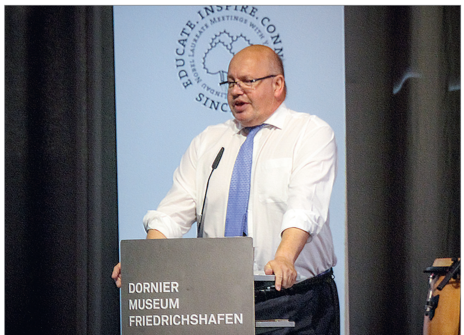
Peter Altmaier, Kanzleramtsminister, hielt die Festrede im Dornier-Museum.