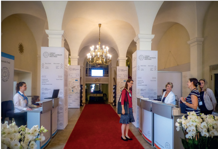
Das Stadttheater in Lindau bot dieses Jahr den Rahmen für die hochrangige Veranstaltung.

krieg erreichen. Die Nobelpreisträger sagten damals spontan zu und begründeten damit eine Tradition, die bis heute anhält.