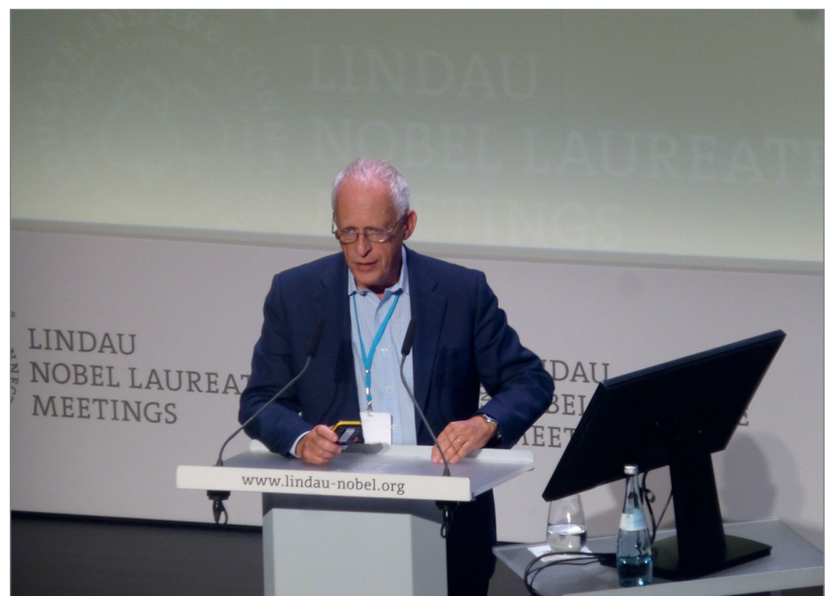
Am Podium standen die Wirtschaftsnobelpreisträger, hier Prof. Dr. Oliver Hart.

Die Treffen der Nobelpreisträger in Lindau haben bereits Tradition. So fand das jährliche Treffen der Nobelpreisträger der naturwissenschaftlichen Disziplinen in diesem Jahr bereits zum 67. Mal statt. Ausgangspunkt dieser Treffen war das Anliegen von Graf Lennart Bernadotte, Enkel des König Gustav V. von Schweden, ein Forum zu schaffen, das dem friedlichen Austausch der Wissenschaftler aus aller Welt dienen sollte. 1951 fand aufgrund seiner engen Beziehungen zum schwedischen Königshaus dieses Treffen erstmals in seiner Residenz auf der Insel Mainau statt. Man wollte eine Annäherung unter Wissenschaftlern nach dem Zweiten Welt-