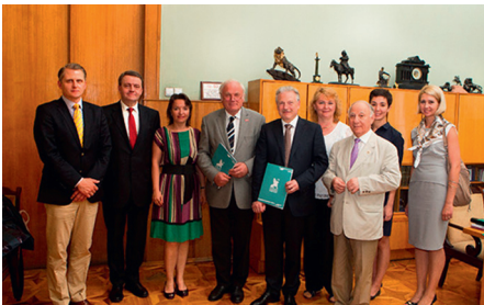
Bei der Unterzeichnung des Kooperationsabkommens Kooperationsabkommen zwischen der Technischen Universität Braunschweig und der St. Petersburg State University of Economics