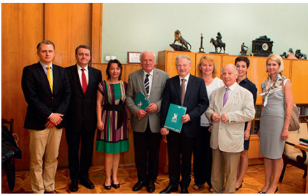
Bei der Unterzeichnung des Kooperationsabkommens Kooperationsabkommen zwischen der Technischen Universität Braunschweig und der St. Petersburg State University of Economics