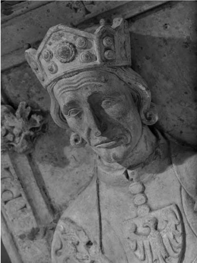
Abb. 3: Grabfigur König Rudolfs von Habsburg, gest. 1291, Speyer, Dom (Detail)

© Foto Marburg, Foto: Helga Schmidt-Glassner; Aufnahme-Nr. 1.561.236; Aufn.-Datum: 1930/1980