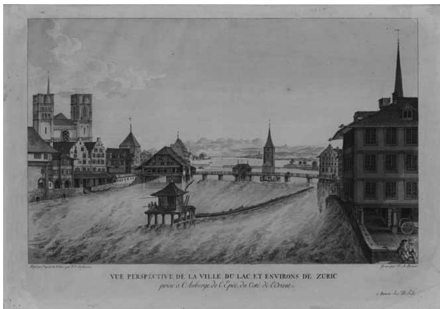
Abb.: Blick auf die Stadt Zürich, den See und die Umgebung (Zentralbibliothek Zürich, Graphische Sammlung und Fotoarchiv)

spüren und ihrer Strafe zuzuführen hatten. Ziel der obrigkeitlichen Normdurchsetzungen war offensichtlich ein Stillstellen des öffentlichen Lebens der Stadt, das während der Gottesdienstzeiten und in eingeschränktem Maße während des gesamten Sonntags auf „Anständigkeit und Stille“ im rein kirchlichen Kontext begrenzt werden sollte. Insbesondere wirtschaftliche Aktivitäten wurden fast vollständig eingeschränkt. Dies erstreckte sich nicht nur auf die Sonn- und Feiertage selbst, sondern auch, wie ein Mandat gegen die Entheiligung der „Heil. Nachttagen an den Hohen Festen“, also wohl der Oster- und Pfingstmontag sowie der zweite Weihnachtstag, auch auf andere Tage: „Und damit dieser heilsame Zweck desto eher erreicht werden möge, so ist unser fernere Befehl, dass an solchen Tagen alles unanständige Gewühl und Unwesen, alles Geläuff aus einem Orth in den andern, alles Marcktwesen, kauffen und verkauffen, alles unnöthige reisen und spatzieren gehen [...] abgestellt werde“ 47 . Auch an Wochentagen, an denen in der Zwinglistadt zwischen 6 und 15 Predigten pro Woche gehalten wurden 48 , sah sich der Rat genötigt, „alles Gelärm und Unfuge, besonders in der Nähe der Kirchen, so etwa den Gottesdienst stören, oder sonstens irgendwo einige Aergerniss geben könnte, bey 5. Pfunden Buss“ zu verbieten 49 .