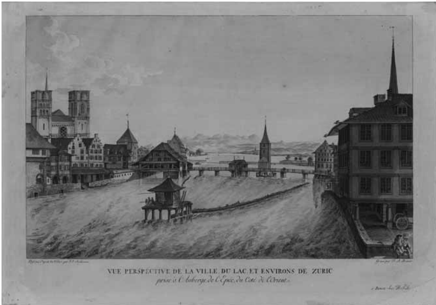
Abb.: Blick auf die Stadt Zürich, den See und die Umgebung

spüren und ihrer Strafe zuzuführen hatten. Ziel der obrigkeitlichen Normdurchsetzungen war offensichtlich ein Stillstellen des öffentlichen Lebens der Stadt, das während der Gottesdienstzeiten und in eingeschränktem Maße während des gesamten Sonntags auf „Anständigkeit und Stille“ im rein kirchlichen Kontext begrenzt werden sollte. Insbesondere wirtschaftliche Aktivitäten wurden fast vollständig eingeschränkt. Dies erstreckte sich nicht nur auf die Sonn- und Feiertage selbst, sondern auch, wie ein Mandat gegen die Entheiligung der „Heil. Nachttagen an den Hohen Festen“, also wohl der Oster- und Pfingstmontag sowie der zweite Weihnachtstag, auch auf andere Tage: „Und damit dieser heilsame Zweck desto eher erreicht werden möge, so ist unser fernere Befehl, dass an solchen Tagen alles unanständige Gewühl und Unwesen, alles Geläuff aus einem Orth in den andern, alles Marcktwesen, kauffen und verkauffen, alles unnöthige reisen und spatzieren gehen [...] abgestellt werde“ 47 . Auch an Wochentagen, an denen in der Zwinglistadt zwischen 6 und 15 Predigten pro Woche gehalten wurden 48 , sah sich der Rat genötigt, „alles Gelärm und Unfuge, besonders in der Nähe der Kirchen, so etwa den Gottesdienst stören, oder sonstens irgendwo einige Aergerniss geben könnte, bey 5. Pfunden Buss“ zu verbieten 49 .