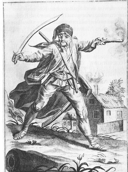
Ein ergrimmter Pandur in seiner Defension. Es steht es der Pandur wann er ergrimmet du fallen. Es brandt wie ein Löwe auf seinen Gegner los. Nicht und droht wie er die Schiffe wolle halten. Das lebe so lang er machet die marcierte Schicksal.