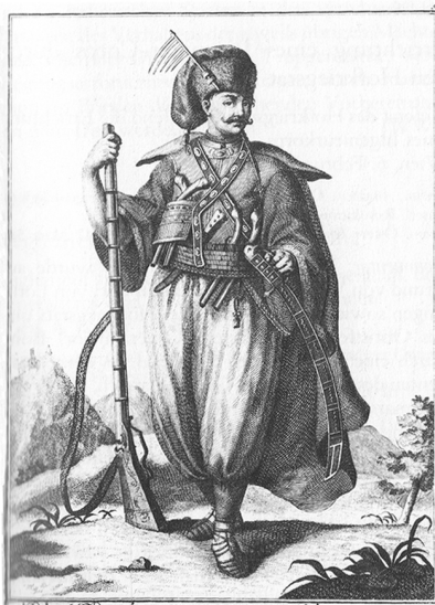
Christ Trenk, Chef der Slavonischen Panduren, welche A° 1741 nach Böhmen marchirte. Er ist der lauffte Trunk in seinem Schweiß zu schmecken. Willen hinter ihn kommen auf Rückenstücke weiß. Weil er wie man will gefesselt und gefesselt. Das macht manne einen Trunk noch mit fünfzig Köpfen weiß.