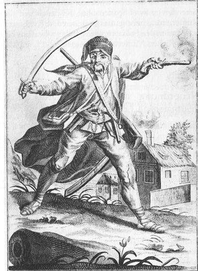
Ein ergrimmter Pandur in seiner Defension. Er steht es der Pandur wann er ergrimmt zu fallen. Er brandt wie ein Löwe auf seinen Gegner los. Nicht und nicht wie er die Schiffe wolle halten. Das ist er lang er macht sie marciare Schloß.