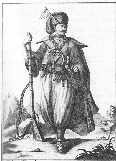
Christ Trenk, Chef der Slavonischen Panduren, welche A° 1741 nach Böhmen marchirte. Es ist der lauffte Trunk in seinen Schweiß du schwin. Willen hinter ein bruchel auf Rückenleibe weis. Weil er wie man will geflohen und gehien. Das macht manne einen Trunk noch mit fünfzig Köpfelein weis.