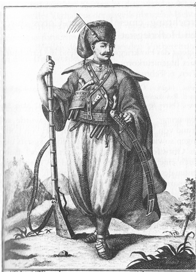
Christ Trenk, Chef der Slavonischen Panduren, welche A° 1741 nach Böhmen marchirte. Es ist der lauffte Trunk in seinen Schweiß zu schmecken. Willen hinter ihn kommen auf Rückenstücke weiß. Weil er wie man will gefesselt und gefesselt. Das macht manne einen Trunk noch mit fünfzig Nägeln weiß.