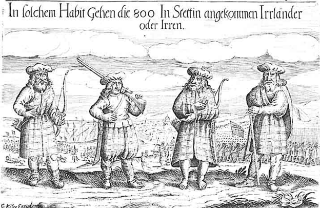
Es ist ein Starckes dauerhaftiger Volck behufft sich mit geringer preiß hatt es nicht brodt so Essen sie Würtzeln. Wans auch die Nottufft erfordert Können sie des Tages Ober die 20 Teütscher meilweges laufen. haben neben Flugueden Ihre Bogen vnd Köcher vnd lange Messer.

M Als nun zum öffternmal/ wegender Volck's so auß En- gelland/ Königl. Mayst. in Schweden überkommen solte/ gemeldet worden/ ist jetzt auß gewieser Nachrich- tung zu seinem völligen Effect gerathen/ so/ das wir nit allein auß den Particularen als auch ins gemein der Gewisheit halber nicht zu zweiffeln. Unter ermeldten 17. tausenten/ sehr wol Mundirten/ mit Prebiant/ Munition/ vnd Geld wol versehenem Volck/ sind auch zugleich s. hundert Irren oder Ir-Länder/ sonsten Hibern oder nach der Insel so sie bewohnen/ Hibernia genant/ mit angelangt. das Land aber das sie bewohnen/ ist ein vngelei- che Erde oder Land/ bergig vnd Stumpffig/ so/ das man auch auff den spitzen/ vnd höchsten Bergen/ sehen die See oder: Pflü- tz findet/ jedoch hat es an etlichen orten auch gar schöne Plätz/ vnd Ebne. Das Land das sie bewohnen/ ist auch verümbt/ we- gen deß gar fetten Leymens/ vnd reicher herfür Bringung al- lerley Früchte. Die Berg des Landes sind vol Viehs/ die Wäl- ter voller wilden Thier/ jedoch ist diese Insel oder Land mehr an der weyde/ als Früchten/ mehr an Gras/ als Korn fruchtbar. Dammas der Leuz oder Frülhing hervor bringet/ vnd die