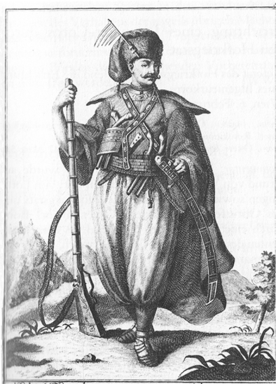
Christ Trenk, Chef der Slavonischen Panduren, welche A° 1741 nach Böhmen marchirt. Er ist der lauffte Trunk in seinem Schmauck zu schmecken. Willen hinter ihn kommen auf Böhmenische weis. Weil er wie man will gefesselt und gefesselt. Das macht manne einen Trunk noch mit fünfzig Köpfelein weis.