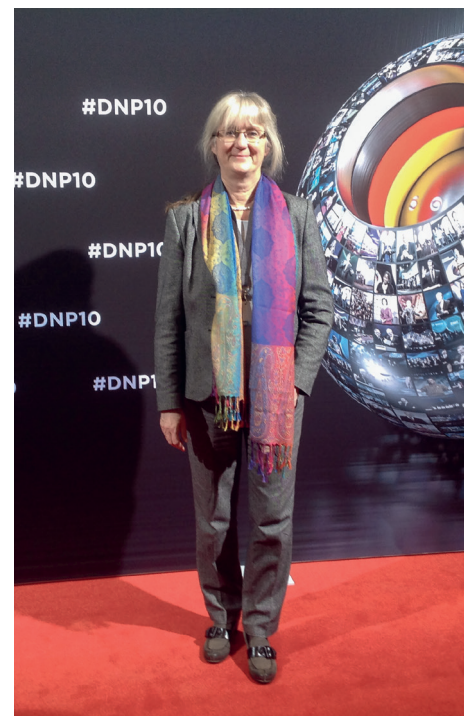
Spannende Themen auch aus betriebswirtschaftlicher Sicht wurden beim Kongress zum Deutschen Nachhaltigkeitspreis behandelt.